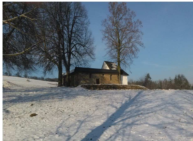
Poklidný zimní pohled od západu.