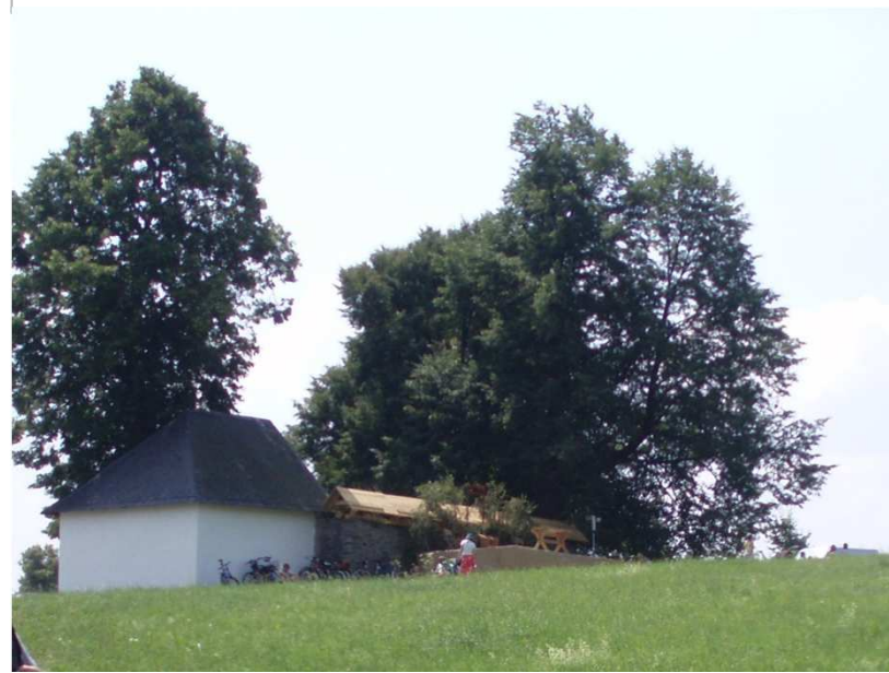
Dnešní letní pohled v době konání poutě.