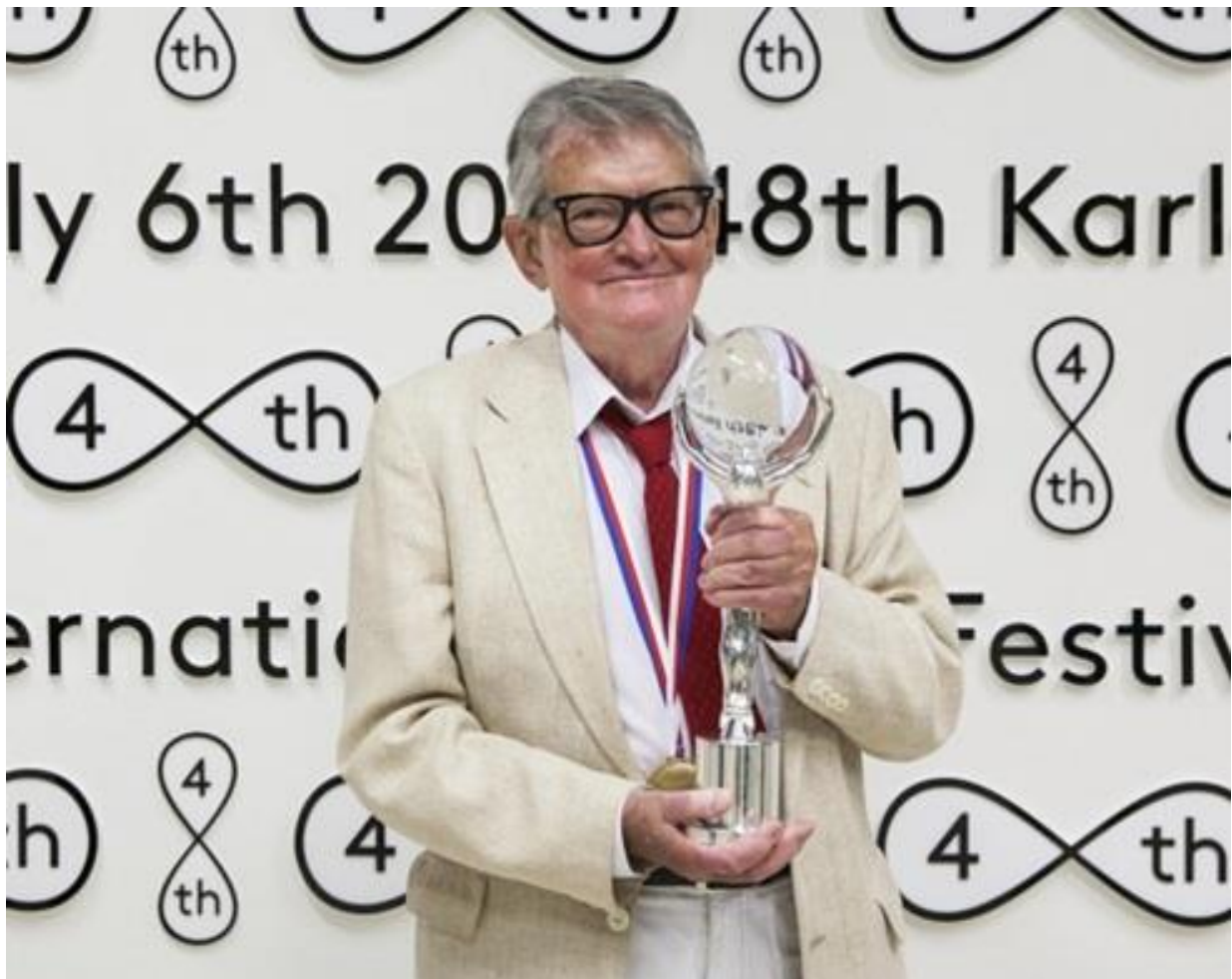
Ocenění Vojtěcha Jasného v Karlových Varech za přínos české kinematografii (2013)