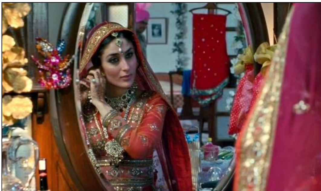
Obrázek 8: Svatební oděv indické nevěsty