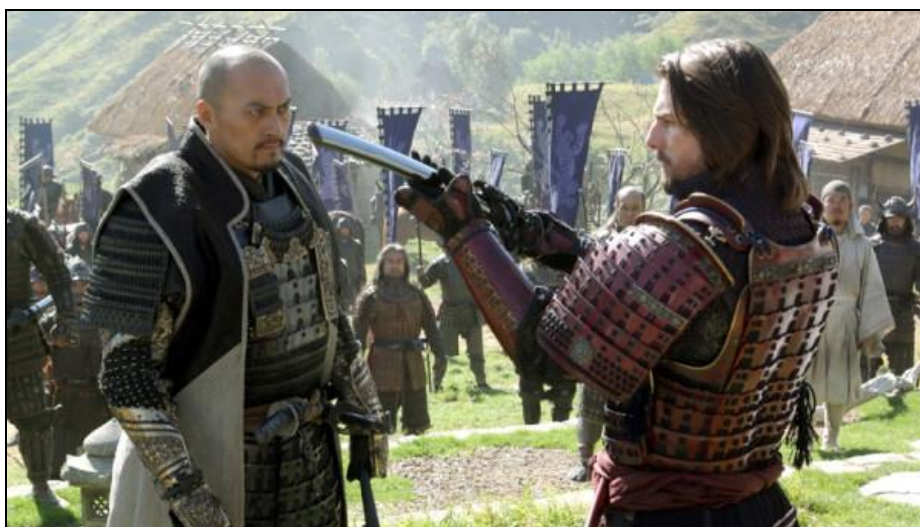
Obrázek 1: Filmová replika samurajské zbroje