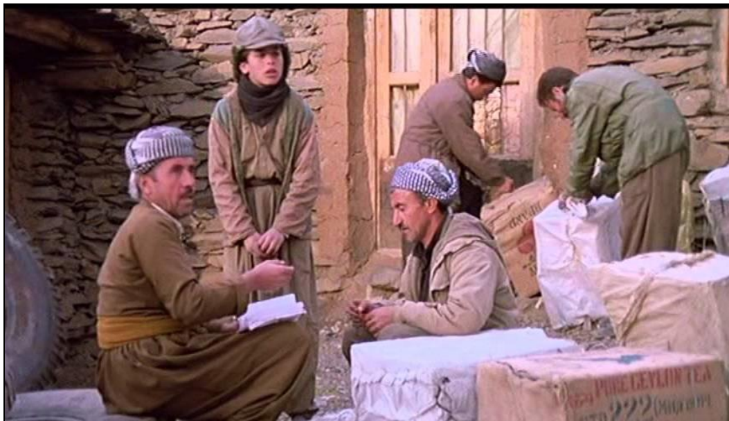
Obrázek 14: Příprava zboží k převozu