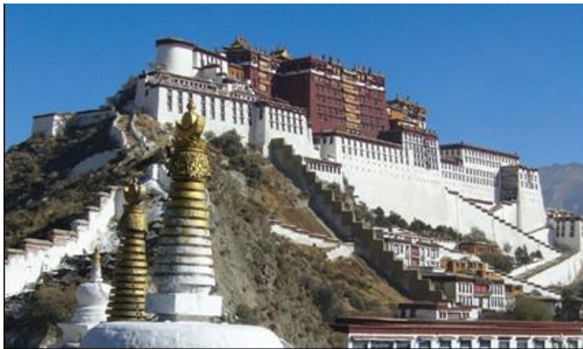
Obrázek 5: Palác Potála