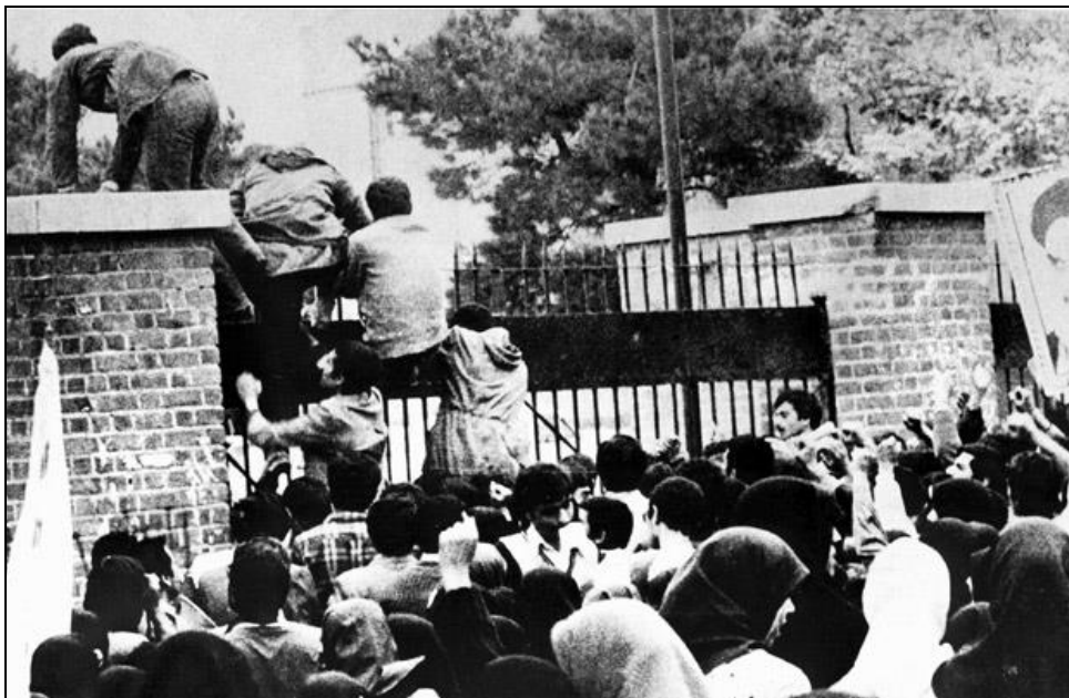
Obrázek 13: Autentický snímek použitý ve filmu – vzbuřenci přelézají plot americké ambasády v Teheránu