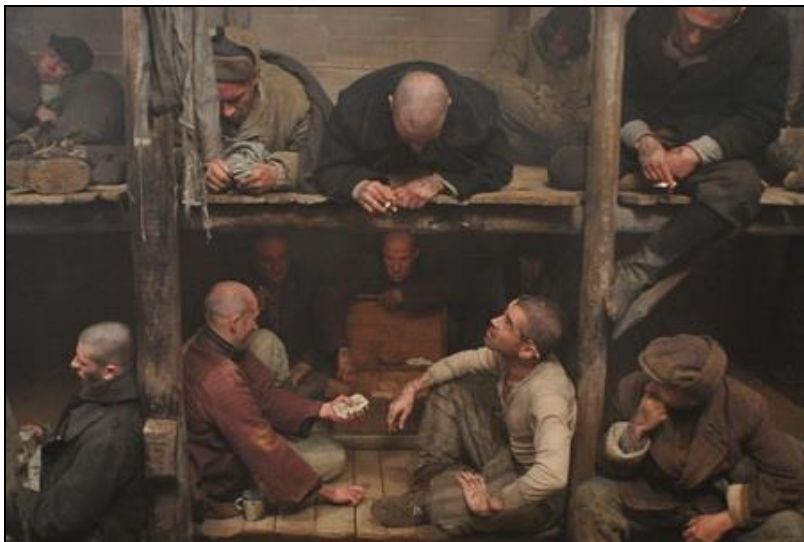
Obrázek 19: Prostory pro spaní v gulagu