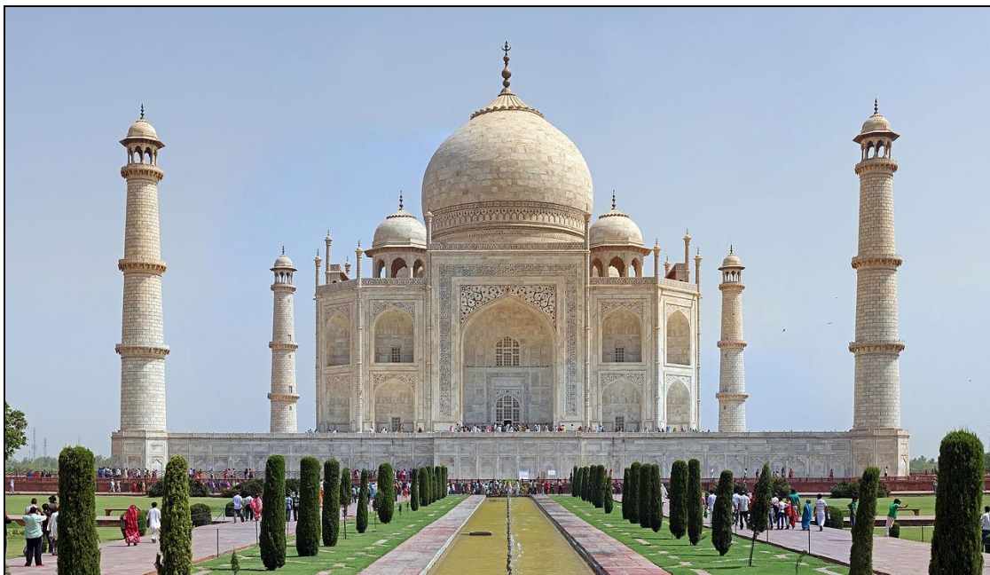
Obrázek 11: Tádž Mahal