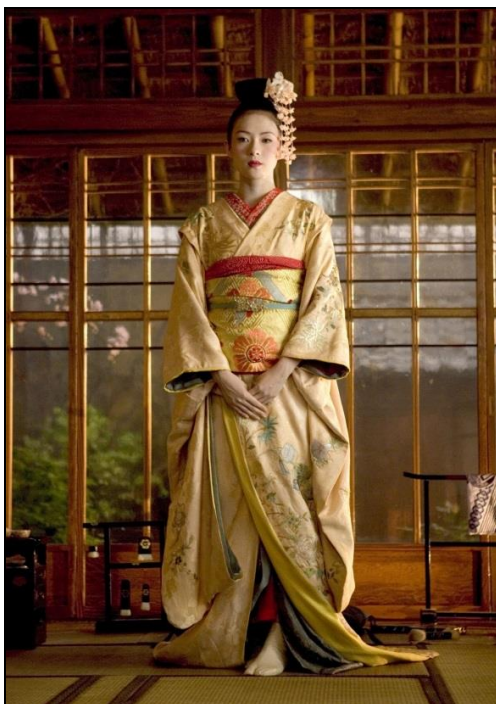
Obrázek 2: Gejša vstrojená do společnosti