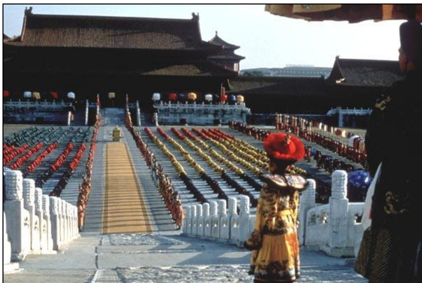
Obrázek 4: Malý Pchu I v Zakázaném městě