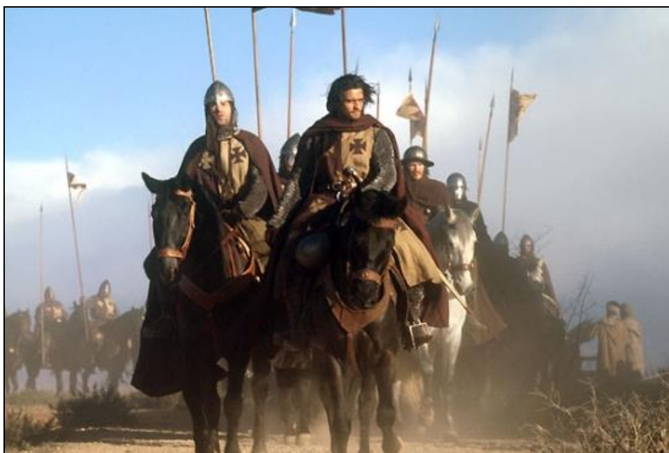
Obrázek 18: Křižácké vojsko