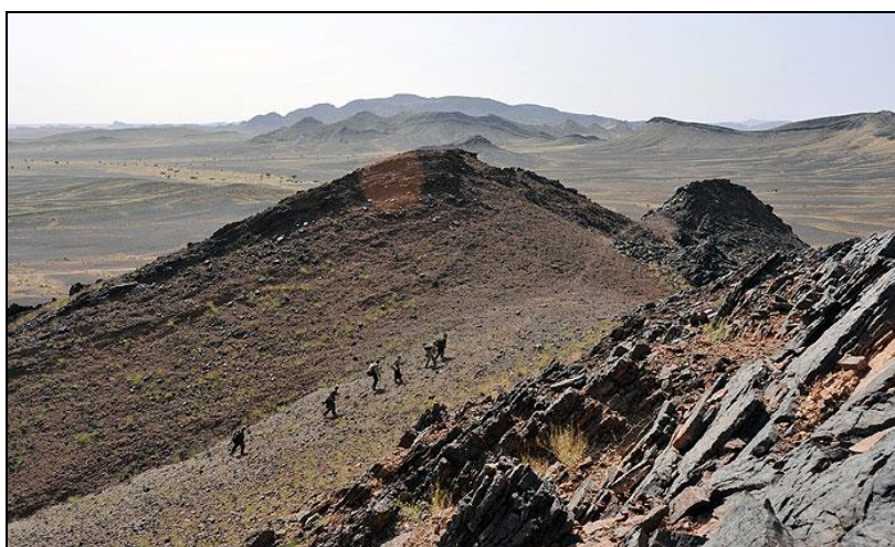
Obrázek 20: Poušť Gobi na severu Mongolska