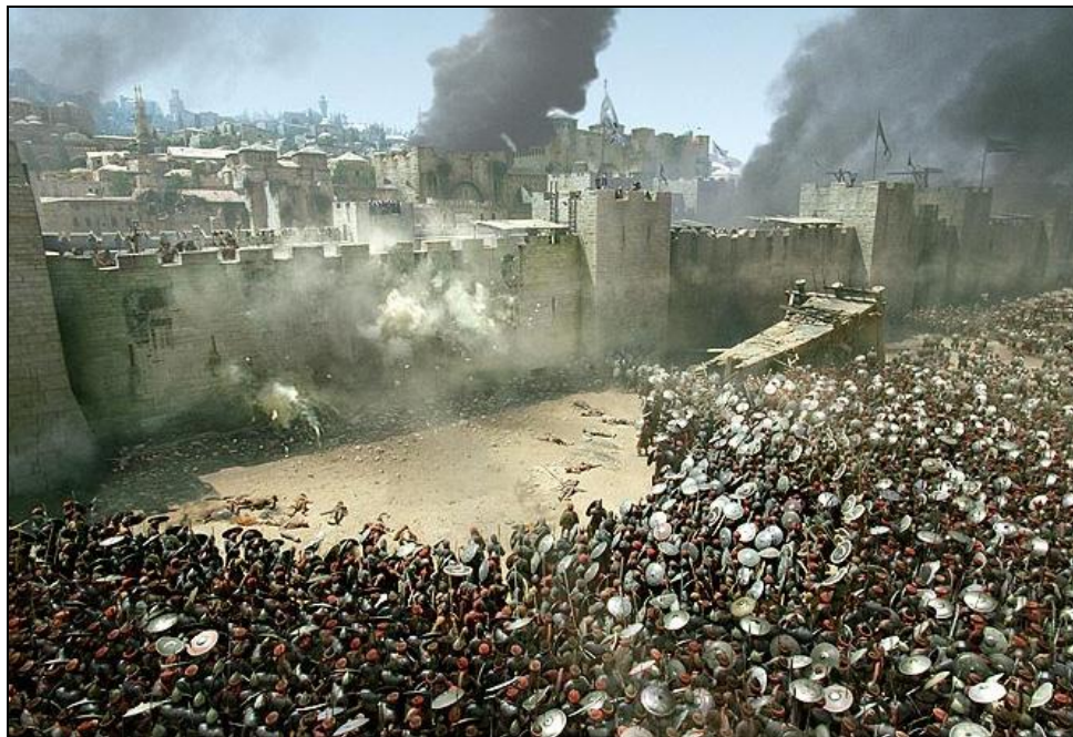
Obrázek 17: Dobývání Jeruzaléma muslimským vojskem