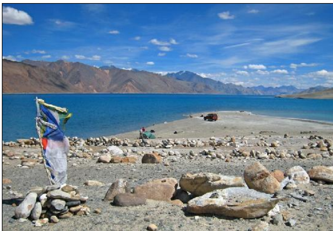
Obrázek 9: Jezero Pangong Tso v Ladákh