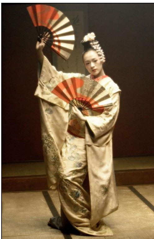
Obrázek 3: Vystoupení gejši