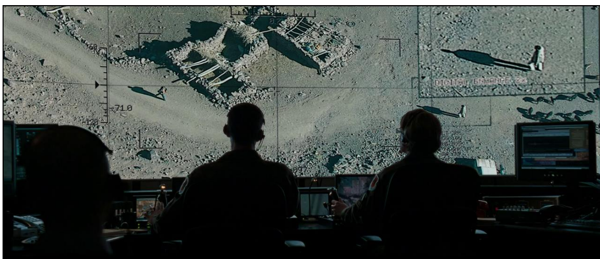
Obrázek 16: Tajná služba sleduje cíle v Iráku