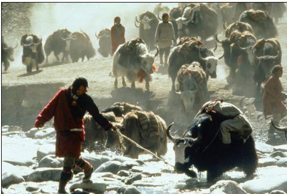
Obrázek 7: Karavana jaků