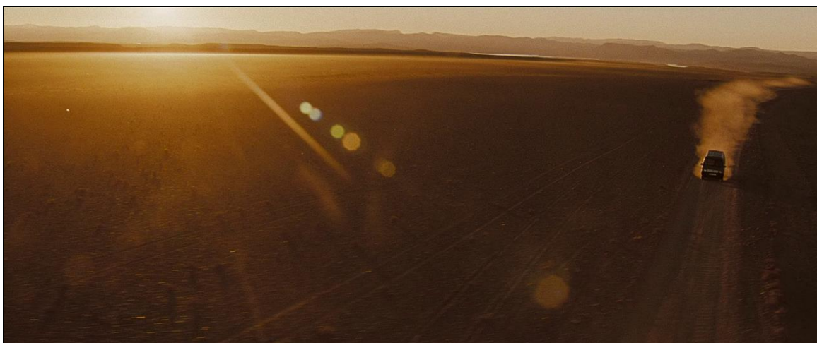
Obrázek 15: Záběr z filmu natočený v poušti v Sýrii