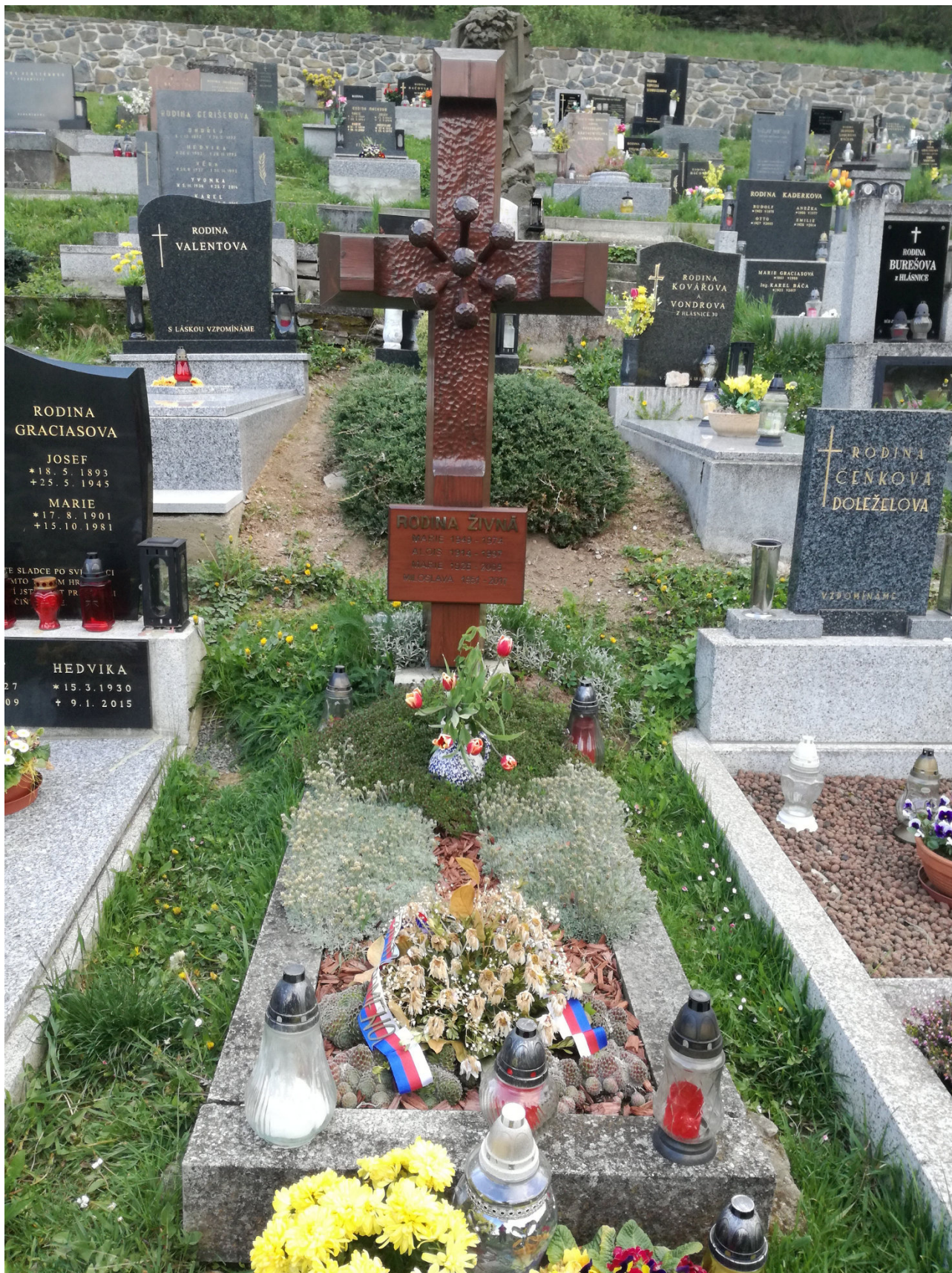
Obrázek 5 Hrob Živných ve Svojanově