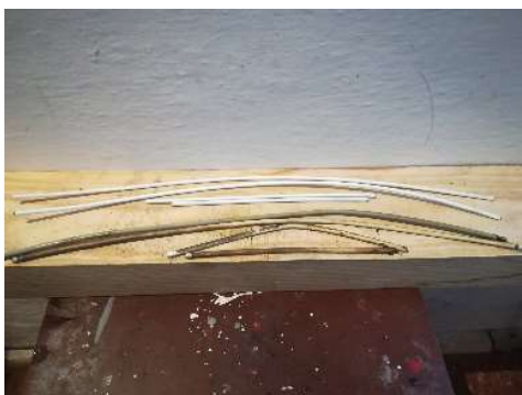
Staré a nové bowdeny

V e-shopu, který je zaměřený na stará jízdní kola, jsem dokoupil díly, které na kole chyběly nebo byly nepoužitelné. Koupil jsem brzdové destičky, všechna lanka s bowdeny, dynamo s držákem, duše, pláště a stojánek.