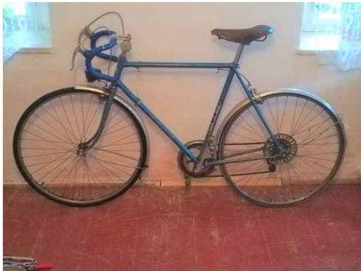
Favorit před renovací

Rozhodl jsem se kolo renovovat se zachováním původních dílů. Dokoupil jsem chybějící a defektní díly.