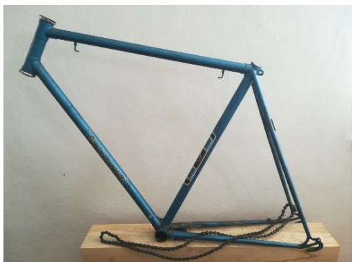
Rám s řetězem