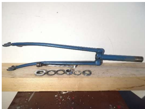
Hlavové složení s vidlicí

Na spodní trubku rámu jsem přišrouboval páčku přehazovačky a natáhl k ní lanko. Dále jsem přidal sedlovou trubku se sedlem. Nakonec jsem přidělal dynamo s držákem a do obou světel jsem zavedl elektrické drátky.