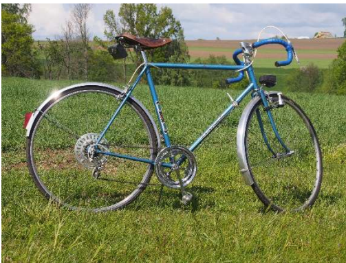
Hotové kolo zprava