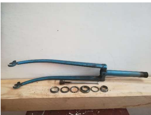
Hlavové složení vidlicí