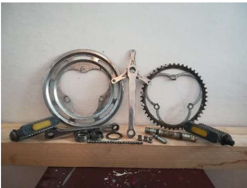
Středové složení s talíři