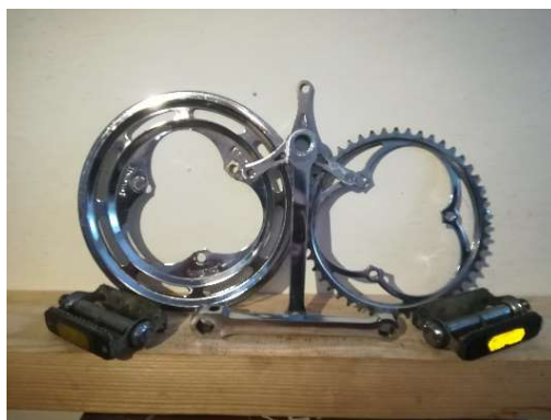
Kliky s talíři