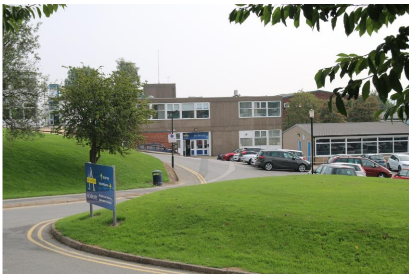
Obrázek 4: Swinton academy