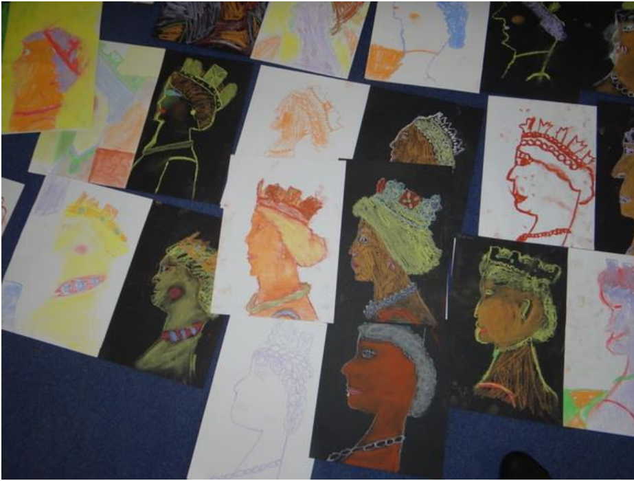
Obrázek 7: Naše