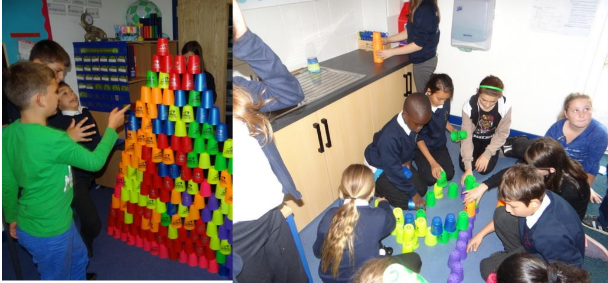
Obrázek 9: Hra s kelímký

Potom nám paní učitelka četla pohádku. Sice jsme jí nerozuměli ale byla zábava poslouchat někoho plyně mluvit anglicky. Potom paní učitelky vytáhly hromadu kelímků a začali nás učit nějaké triky. Taky jsme se pokoušeli postavit z těch kelímků jednu obrovskou pyramidu.