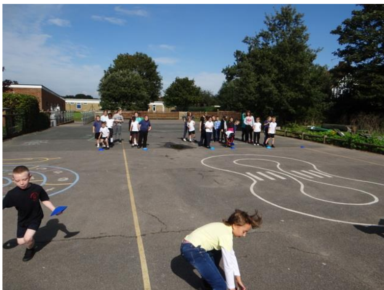
Obrázek 11: Tělocvik

Když jsme přetrpěli tělocvik, měli jsme hudebku. Už nevím, co jsme zpívali, ale myslím si, že to byla anglická hymna a jako poslední hodinu jsme měli výtvarku. Vybarvovali jsme Anglickou a Americkou vlajku. Potom jsme se rozloučili a vyrazili zpátky na hotel.