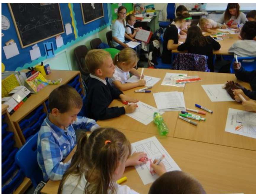
Obrázek 12: Výtvarka

Když jsme přetrpěli tělocvik, měli jsme hudebku. Už nevím, co jsme zpívali, ale myslím si, že to byla anglická hymna a jako poslední hodinu jsme měli výtvarku. Vybarvovali jsme Anglickou a Americkou vlajku. Potom jsme se rozloučili a vyrazili zpátky na hotel.