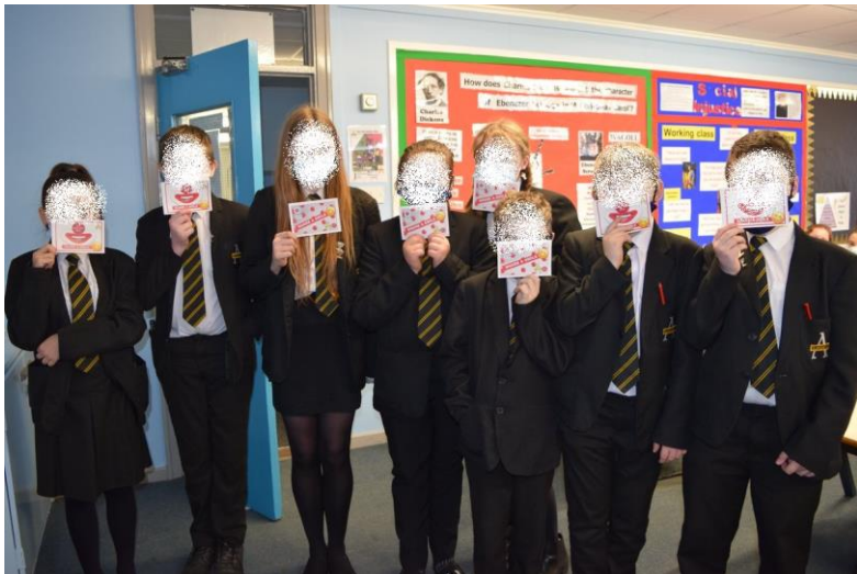
Obrázek 5: School uniforms at Swinton