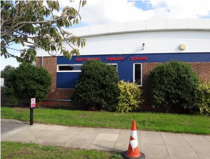
Obrázek 6: Norsthdwn Primary