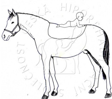
Fotografie 5: Poloha+ primárního vzpřímení[1]