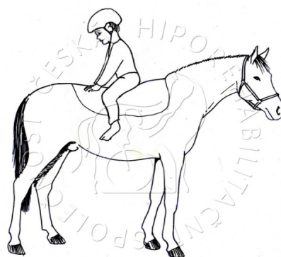
Fotografie 6: Opačný sed[1]