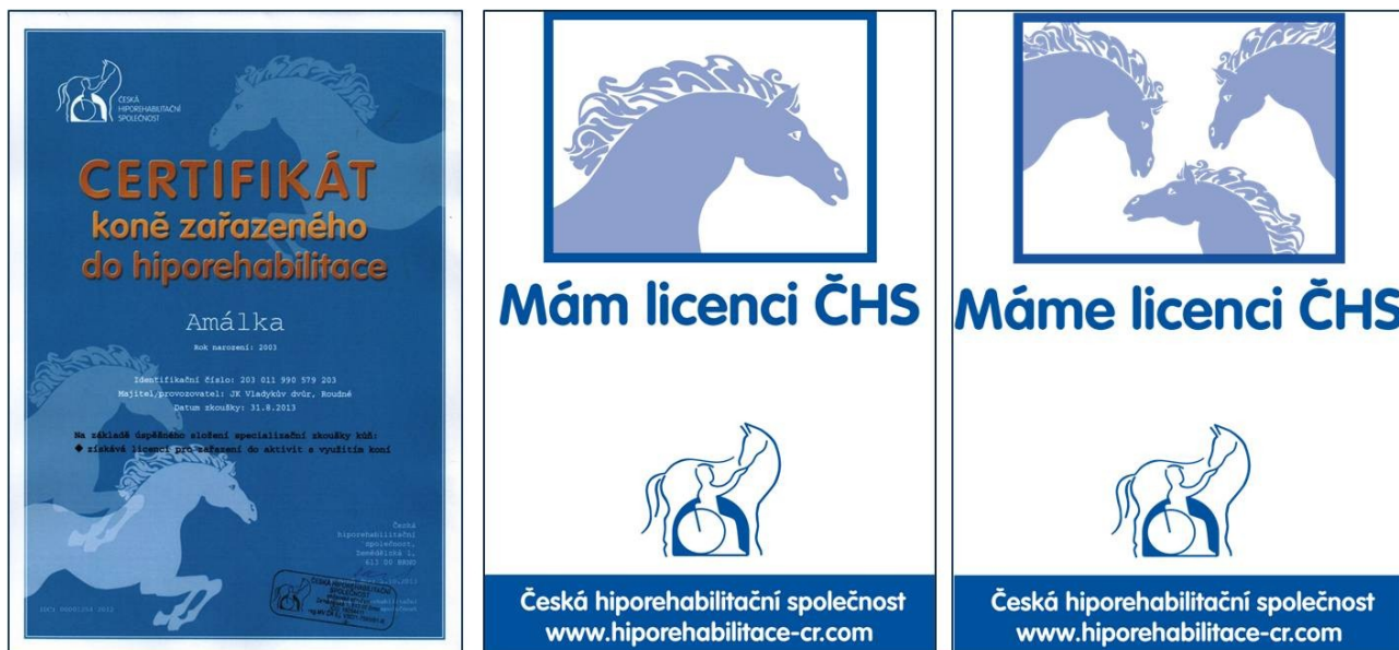
Fotografie 3: Nalevo certifikát, napravo štítek na box (stáj)[1]

Po úspěšném složení speciální zkoušky majitel koně obdrží certifikát koně – licenci a také dostane cedulku, kde je logo „Mám/máme licenci“, která se dává na box (stáj) koně a také ji majitel většinou umístí na své webové stránky.